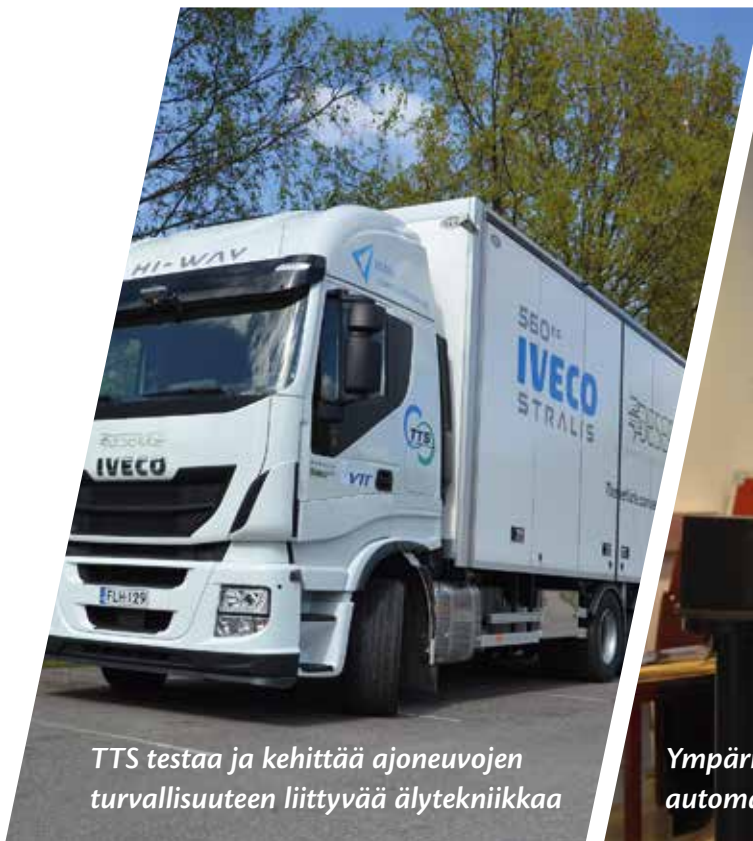
TTS testaa ja kehittää ajoneuvojen turvallisuuden liittyvää älytekniikkaa